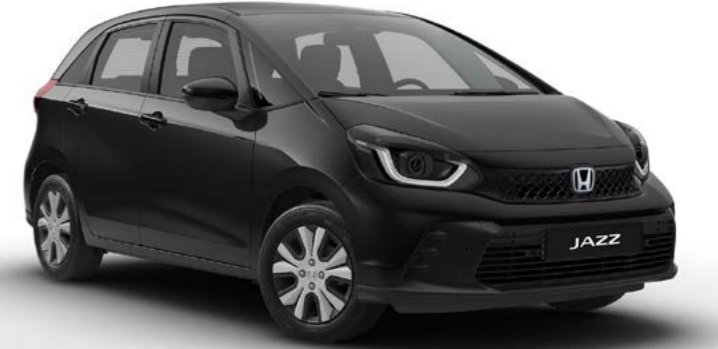
Elegance Kristal Siyah Sedefli