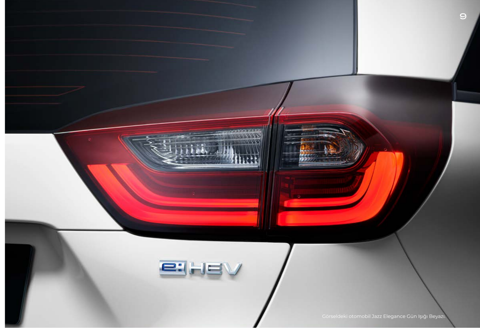
Görseldeki otomobil Jazz Elegance Gün Işığı Beyazı.