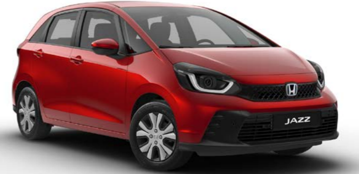
Elegance Kristal Kırmızı Metalik