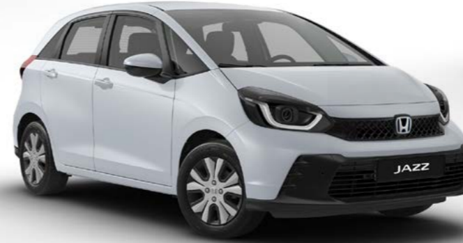
Elegance Gün IşığI BeyazI Sedefli