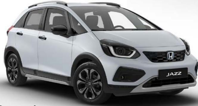
Crosstar Gün IşığI BeyazI Sedefli