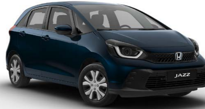
Elegance Gece Yarısı Mavisi Metalik