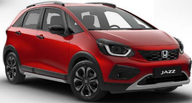
Crosstar Kristal Kırmızı Metalik