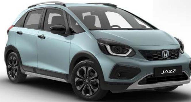
Crosstar Fiyort Mavi Sedefli